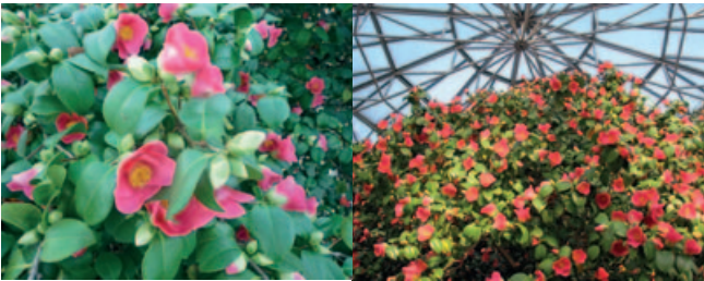
Die Blüten der Pillnitzer Kamelie

Im Jahre 1992 wurde für die Pillnitzer Kamelie ein neues, gläsernes Schutzhaus eingeweiht. Dieses 13,2 Meter hohe und 54 Tonnen schwere Haus schützt die Kamelie nun von Oktober bis Mai. Das moderne, 1864 Kubikmeter umfassende fahrbare Gebäude ersetzt eine hölzerne Schutzkonstruktion, welche man zuvor jährlich mit großem Aufwand für die kalte Jahreshälfte um die kostbare Kamelie auf- und abbaute. Es wird auf eine Lufttemperatur von vier bis sechs Grad Celsius geheizt. In der warmen Jahreszeit wird das schützende Winterhaus der Kamelie zu Seite gefahren. Das Glashaus fährt dabei auf nur vier Rädern gestützt auf einer Breitspur, Spurweite 10.800 Millimeter.