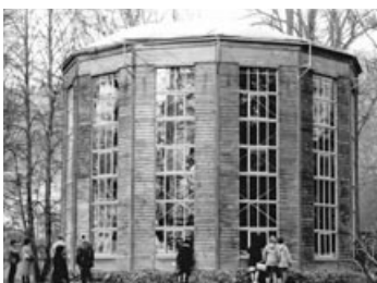
Altes Kamelienhaus, 1983

Die Pillnitzer Kamelie ist eine der ältesten in Europa befindlichen Kamelien ( Camellia japonica ). Mittlerweile über 240 Jahre alt, hat sie eine Höhe von 8,94 Metern und einen Kronendurchmesser von fast 12 Metern erreicht. Während ihrer von Februar bis April dauernden Blütezeit erscheinen bis zu 35.000 Blüten. Diese sind von karminroter Farbe, ungefüllt und ohne Duft. Die Pflanze befindet sich im Park des Schlosses Pillnitz und wird vor Frösten durch ein fahrbares Gewächshaus geschützt.