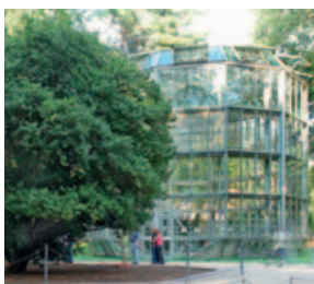
Kamelienhaus Pillnitz, heute

Erste Exemplare der in Südost- und Ostasien beheimateten Kamelien wurden bereits im 17. Jahrhundert nach Europa gebracht. Nach einer weitverbreiteten, aber heute zunehmend bezweifelten Legende soll die Pillnitzer Kamelie als eines von vier Exemplaren von Carl Peter Thunberg von seiner Japanreise 1775 bis 1776 nach Kew Gardens in London mitgebracht worden sein. Während eine der vier Pflanzen in London blieb, wurden die übrigen an andere königliche Gärten verschenkt. Ein Exemplar ging nach Schönbrunn, eine weitere wurde dem Berggarten in Hannover-Herrenhausen überreicht und die vierte soll in den 1780er Jahren an den Hof von Dresden gelangt sein. Wenn diese These zuträfe, wäre die Pillnitzer Kamelie das einzige bis heute überlebende Exemplar der vier aus Japan mitgebrachten Kamelien.