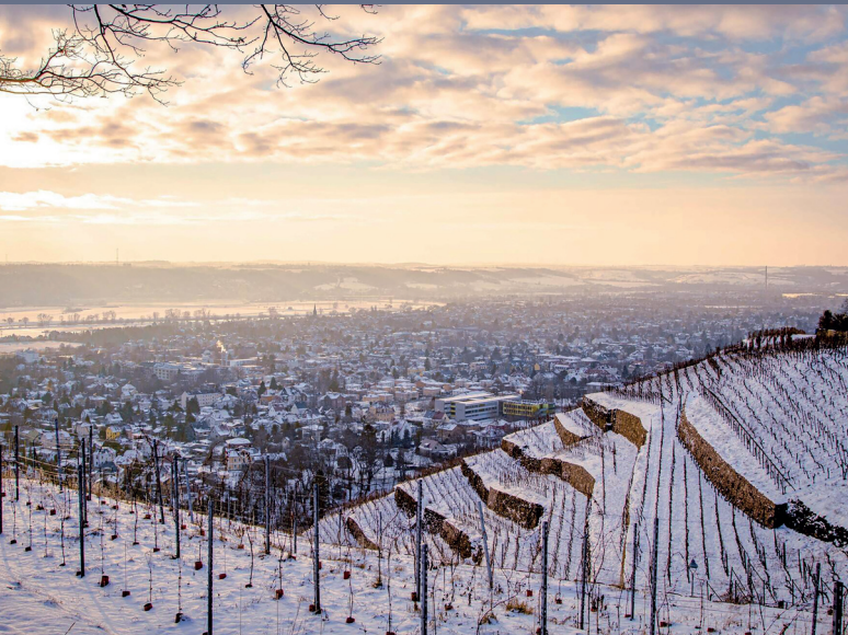
Ausblick über die Radebeuler Weinhänge im Winter